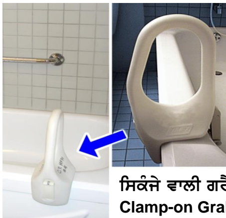
ਸਿਕੰਜੇ ਵਾਲੀ ਗਰੈਬ ਬਾਰ Clamp-on Grab Bar