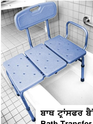
ਬਾਥ ਟ੍ਰਾਂਸਫਰ ਬੈਂਚ Bath Transfer Bench