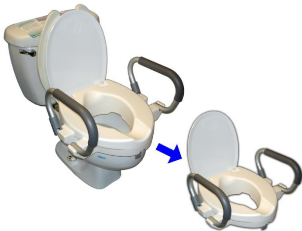
ਬਾਹਾਂ ਵਾਲੀ ਉੱਚੀ ਕੀਤੀ ਹੋਈ ਟੋਆਇਲਿਟ ਸੀਟ Raised Toilet Seat with Arms