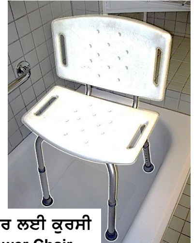
ਸ਼ਾਵਰ ਲਈ ਕੁਰਸੀ Shower Chair