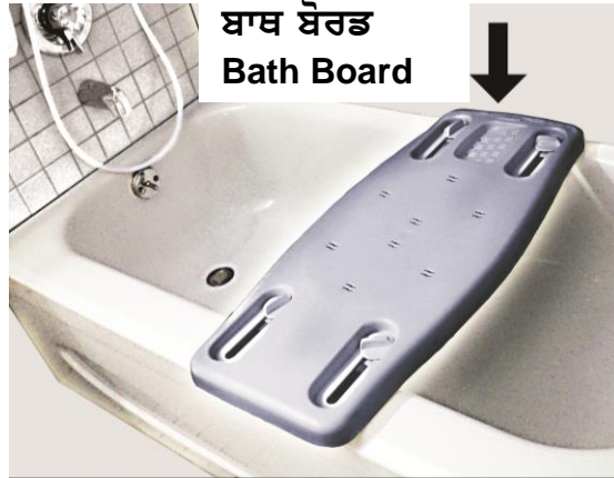
ਬਾਥ ਬੋਰਡ Bath Board